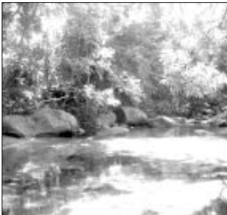
Pozo de Arena Cuyagua