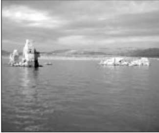
La iglesia del pueblo sumergido en Camatagua