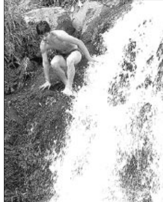
Choros de Cura la segunda caída de agua más alta de Venezuela