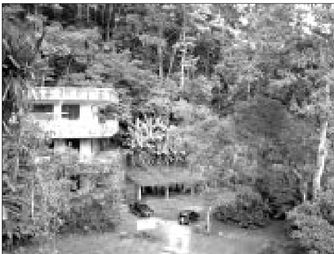
Estación Biológica Rancho Grande

públicos que trabajan los 365 días del año, y durante las 24 horas del día para salvaguardar aquellas regiones que han sido protegidas por el Estado Venezolano, por su belleza escénica natural, o por la flora de importancia nacional que en ellas se encuentran, denominadas Parques Nacionales y Monumentos Naturales. Por su parte, la alcaldesa Belquis Porte, realizó la entrega de reconocimientos y acotó que está comprometida con todos los cambios que se darán en el municipio para declararlo un municipio turístico- ecológico, por tal motivo se encuentra compartiendo con los guardaparques para que cuenten con un apoyo social, espiritual, y material. Porte, finalmente, aseguró que a partir de ahora estará reunida con los jóvenes para apoyarlos "con una mano amiga, para demostrar que me duele la naturaleza y debemos cuidar la atmósfera, el agua, el medio ambiente y evitar que la gente imprudente no arroje basura y hagan quemas".