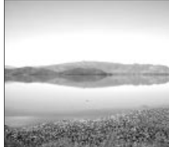
Embalse de Taiguaiquay