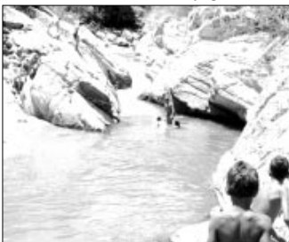
Pozo de los perros - Puerto Maya