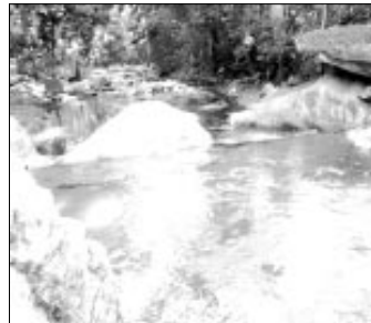
Chopoarmao o Chocoarmao en Cumboto