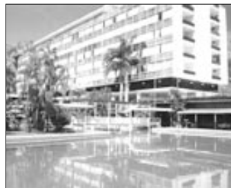
Hotel golf Maracay