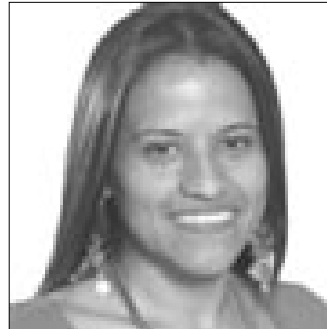
Iris Guzmán Alcaldesa San Casimiro